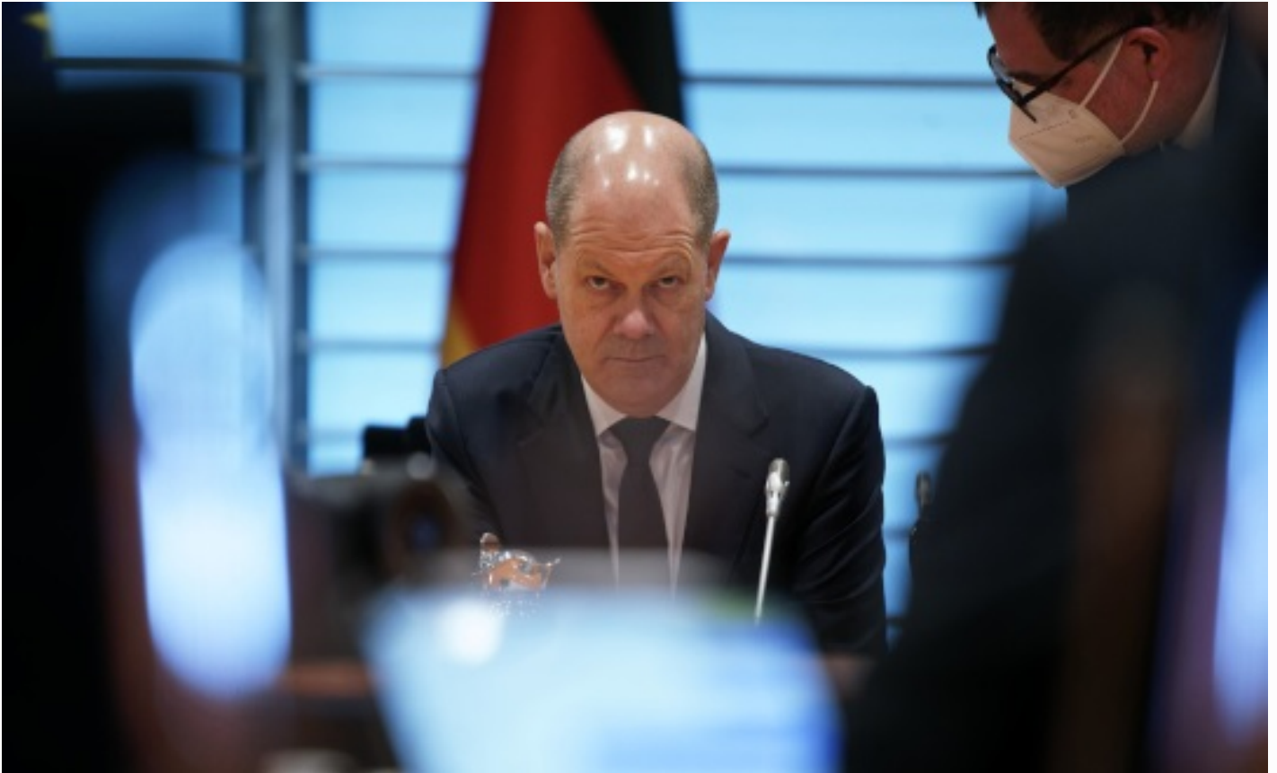
CHANCELIER OLAF SCHOLZ