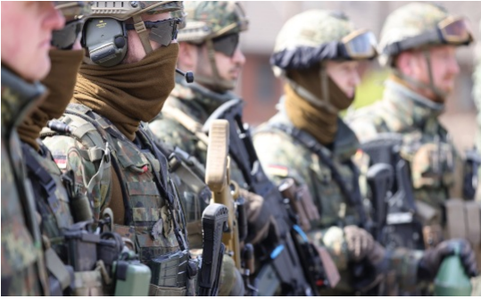
Soldats de la Panzerbrigade 21 (La 21e brigade blindée) de la Bundeswehr.