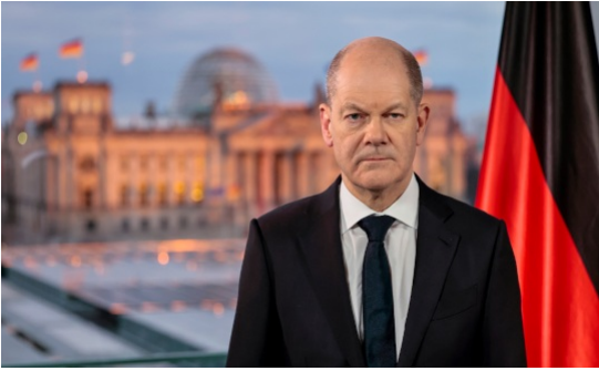
Le chancelier allemand Olaf Scholz