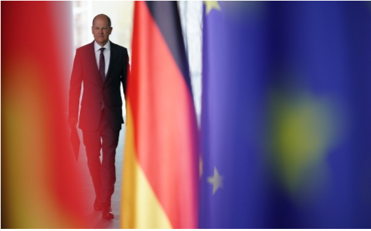
Olaf Scholz à la Chancellerie le 19 avril à Berlin, en Allemagne.