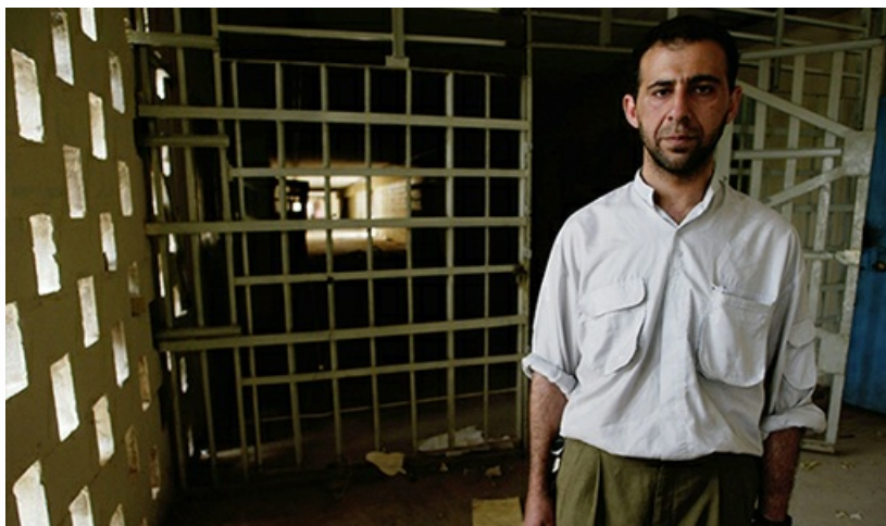
Un ancien prisonnier du régime de Saddam Hussein se tient dans la prison d'Abu Ghraib où il a été détenu prisonnier.

L'histoire est remplie d'exemples de personnes emprisonnées, détenues, réduites en esclavage—sujettes aux pires sortes de punitions et tortures. Et le monde aujourd'hui est rempli de gens qui endurent de telles horreurs.