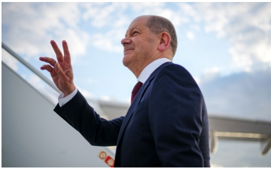
Le chancelier allemand Olaf Scholz