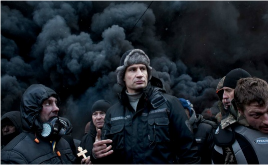
Vitali Klitschko se dirige vers la barricade de la rue Hrushevskoho le 23 janvier 2014 à Kiev, en Ukraine.