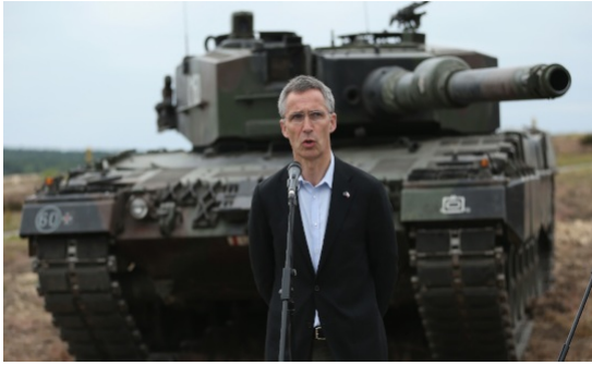
Le secrétaire général de l'otan, Jens Stoltenberg, devant un char Leopard.