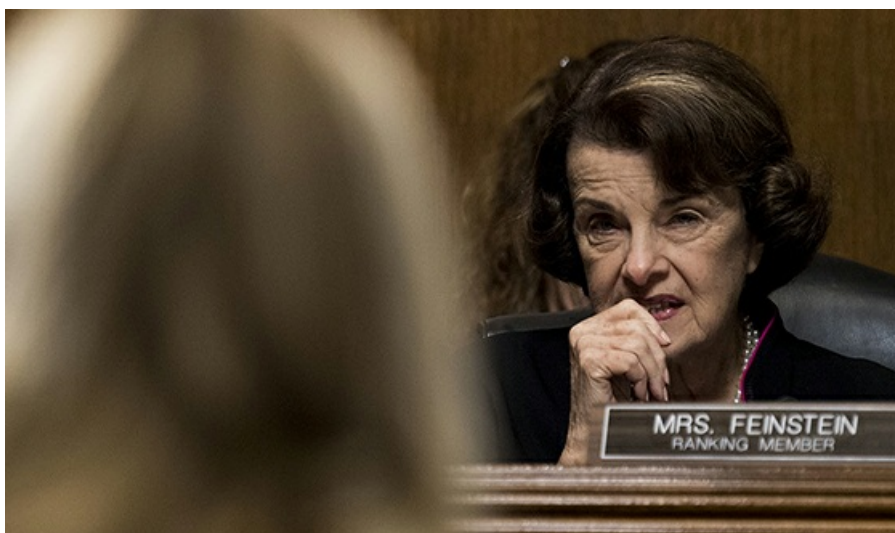
La sénatrice Feinstein

Immédiatement, la gauche radicale s'est retournée farouchement contre elle Ils l'ont condamnée, menacée et harcelée. Des utilisateurs de Twitter ont dit qu'ils voulaient la frapper au visage. Un tweet disait, « Ne laissez plus jamais Mme Collins avoir un moment de paix en public. » Un autre disait, « J'espère que quelqu'un vous tuera. » La Marche pour les Femmes l'a qualifiée d'être une « apologiste du viol ». Des gens ont lancé un boycott du Maine pour convaincre les habitants de l'État de voter contre elle.