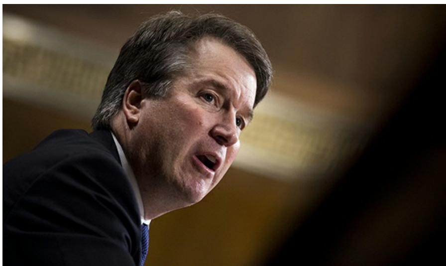
Le juge Kavanaugh

Mme Ford n'a pas affirmé que Kavanaugh l'avait violée, ni même approchée. Néanmoins les démocrates ont insisté sur le fait que cet incident devrait disqualifier à jamais Kavanaugh de siéger à la Cour Suprême. Après qu'un procureur ait déterminé que le récit de Ford était incohérent, vague et non corroboré par les personnes qu'elle avait dit être à cette réception, les Démocrates ont cherché d'autres accusateurs. Ils ont trouvé trois autres femmes qui l'accusaient de mauvaise conduite sexuelle à l'école secondaire et à l'université, incluant des allégations absurdes qu'il avait été impliqué dans des viols collectifs !