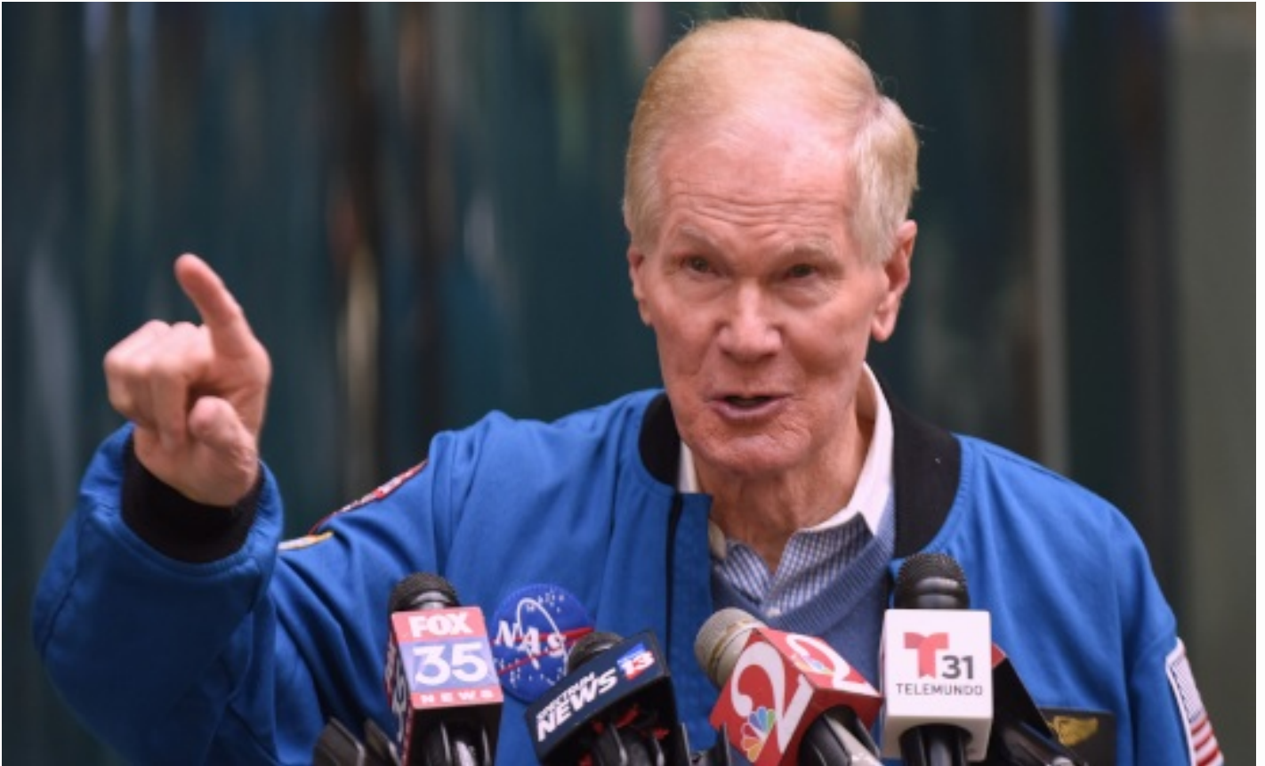
BILL NELSON, ADMINISTRATEUR DE LA NASA