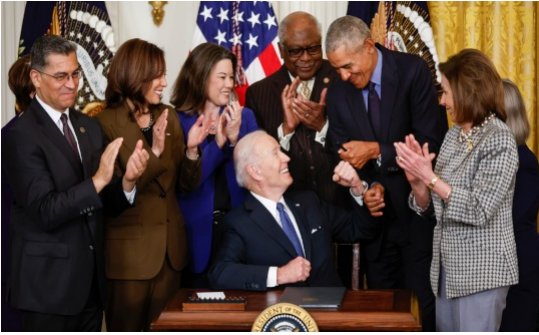
Joe Biden salue Barack Obama après avoir signé un décret présidentiel, le 5 avril à Washington, D.C.