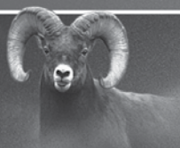
Daniel 8:3, 4, 20