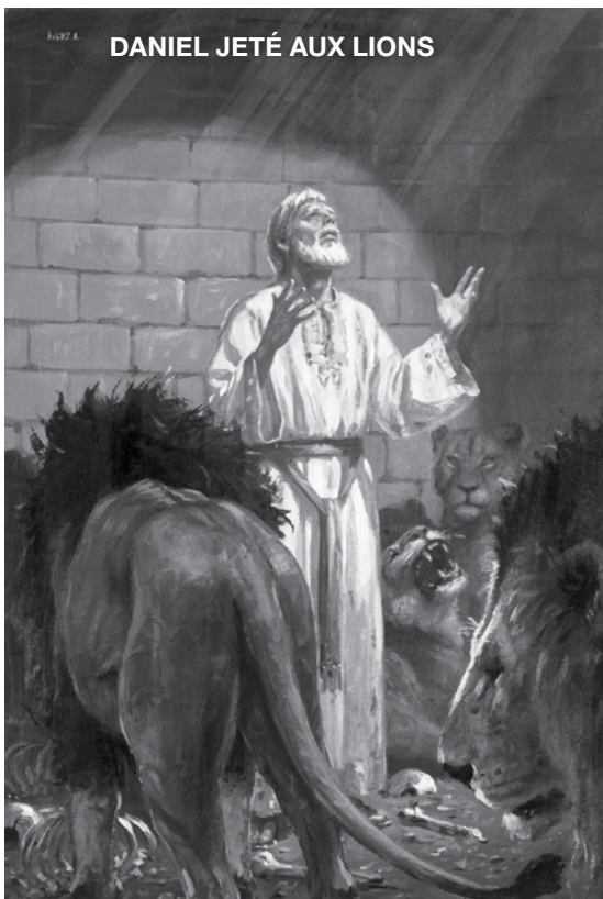
1427 A DANIEL JETÉ AUX LIONS

Il faut beaucoup de foi pour remettre sa vie entre les mains de Dieu, surtout lorsque l'on fait face, ou pire, lorsque l'on est jeté dans une fournaise ardente ou une fosse aux lions. C'était pourtant là tout le thème de Daniel : Dieu est mon Juge. Dans chacun des chapitres, Dieu promet de secourir : Il nous assure qu'Il délivrera Son peuple, s'il est fidèle. Ce livre est également rempli d'exemples fort impressionnants montrant comment