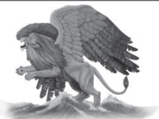
La première bête Un lion ayant des ailes d'aigle. L'Empire chaldéen