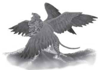
La troisième bête Un léopard à quatre ailes et quatre têtes. L'Empire grec