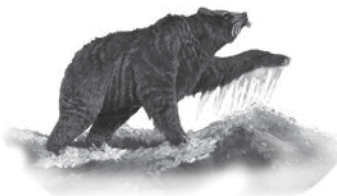
La deuxième bête Un ours tenant trois côtes dans sa gueule. L'Empire médo-perse