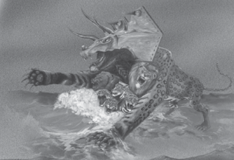
Apocalypse 13:1, 2