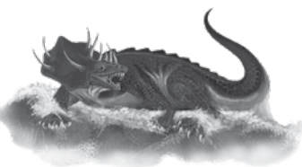
La quatrième bête Terrible et épouvantable. L'Empire romain