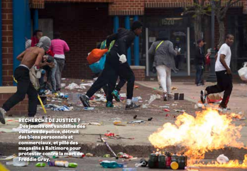
RECHERCHE DE JUSTICE ? Des jeunes ont vandalisé des voitures de police, détruit des biens personnels et commerciaux, et pillé des magasins à Baltimore pour protester contre la mort de Freddie Gray.

sont détournés de Lui et ont refusé de livrer ce message parce qu'ils voulaient enseigner des choses flatteuses et des tromperies ! Heureusement, Dieu a suscité un petit reste pour qu'il livre Son message et montre au monde comment résoudre ces énormes problèmes qui apportent tant de souffrance.