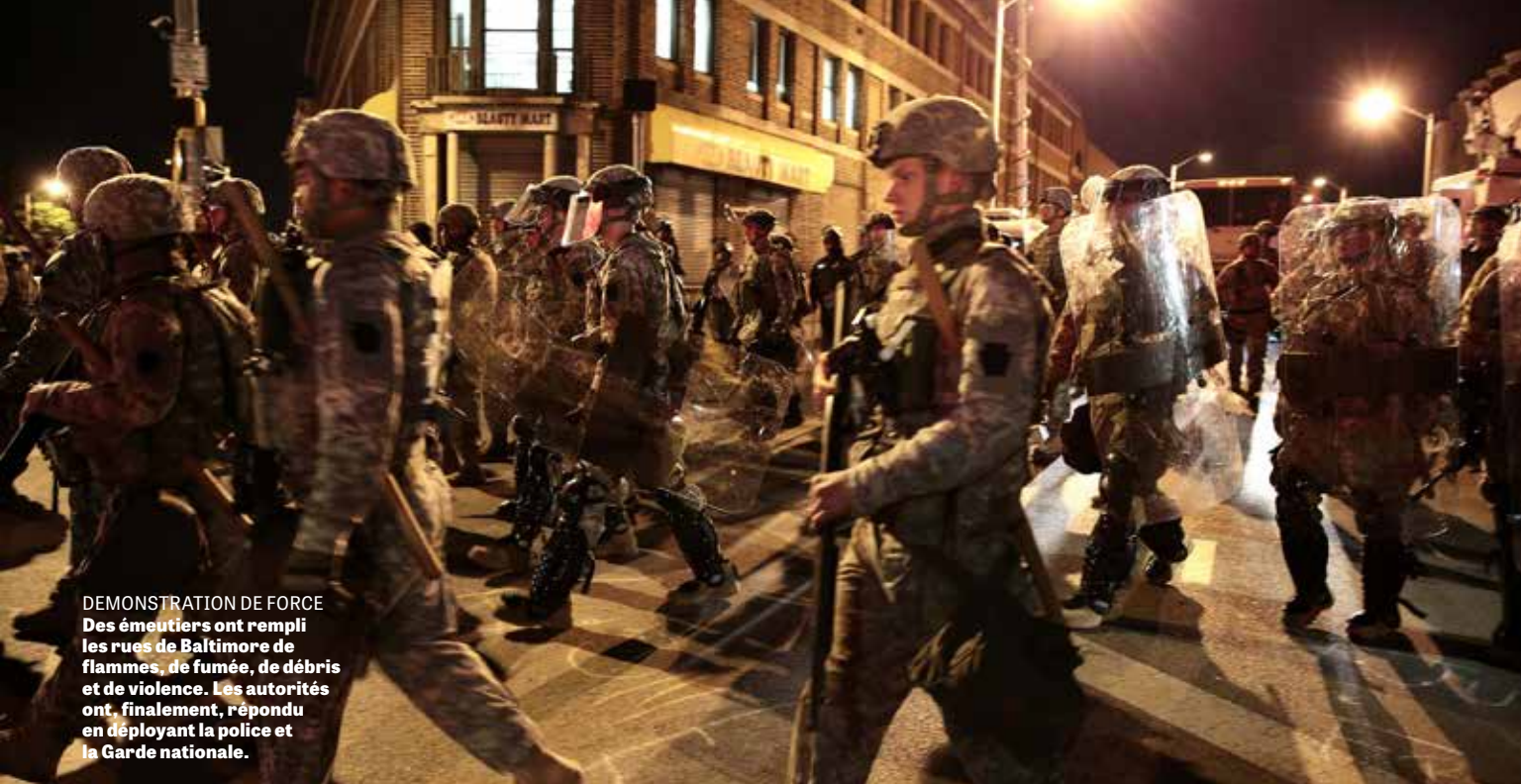
DEMONSTRATION DE FORCE Des émeutiers ont rempli les rues de Baltimore de flammes, de fumée, de débris et de violence. Les autorités ont, finalement, répondu en déployant la police et la Garde nationale.

Par exemple, à New York City, après l'arrestation très en vue, et la mort de Eric Garner pour avoir vendu des cigarettes non taxées, la législation est habillée pour décriminaliser certaines offenses à l'ordre public. Un coup de feu accidentel dans un programme de construction de logements à New York-Est a conduit à des appels téléphoniques pour que la police réduise ses patrouilles aux alentours des HLM. La mort de Michael Brown à Ferguson, dans le Missouri, a créé un mouvement pour la réduction des peines pour défaut de paiement des amendes criminelles et de la circulation, ou pour défaut de présentation devant une cour—même si ce cas n'avait rien à voir avec ces questions !