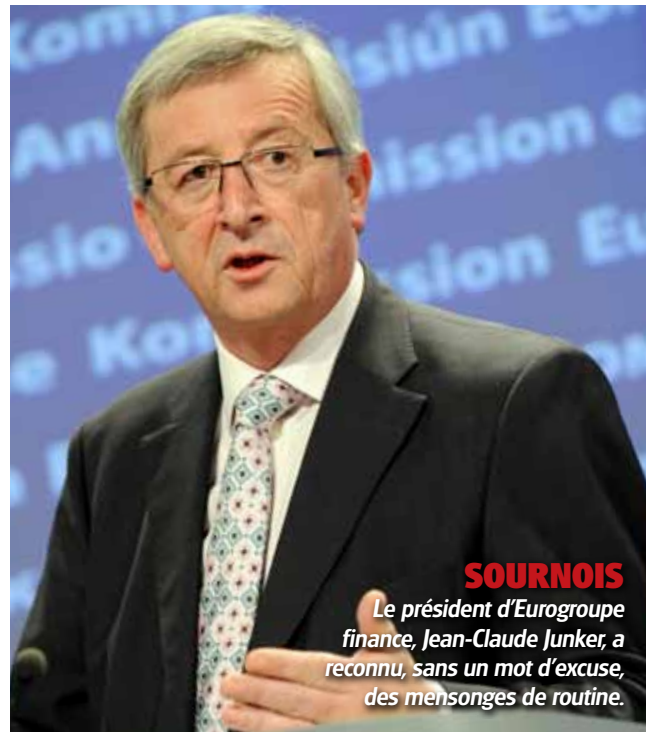
SOURNOIS Le président d'Eurogroupe finance, Jean-Claude Juncker, a reconnu, sans un mot d'excuse, des mensonges de routine.

Pour l'énormité de la tromperie, l'aisance de l'acrobatie, le degré de la duperie pure et celui du mensonge franc, cette Union européenne brutale est inégalée. La raison en est que sa véritable puissance a