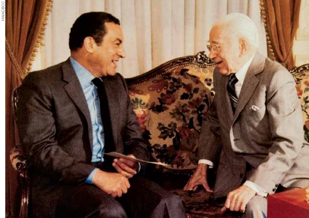
L'ÉVANGILE VA AUX DIRIGEANTS DU MONDE Comme un « envoyé » l'apôtre de Dieu parle aux chefs d'états du monde, proclamant la bonne nouvelle du Royaume de Dieu. Herbert W. Armstrong (droite) vu avec le président de l'Égypte Hosni Mubarak en 1983.

révélation vient de la Bible —c'est de la révélation qui peut être prouvée à partir de la Parole écrite de Dieu.