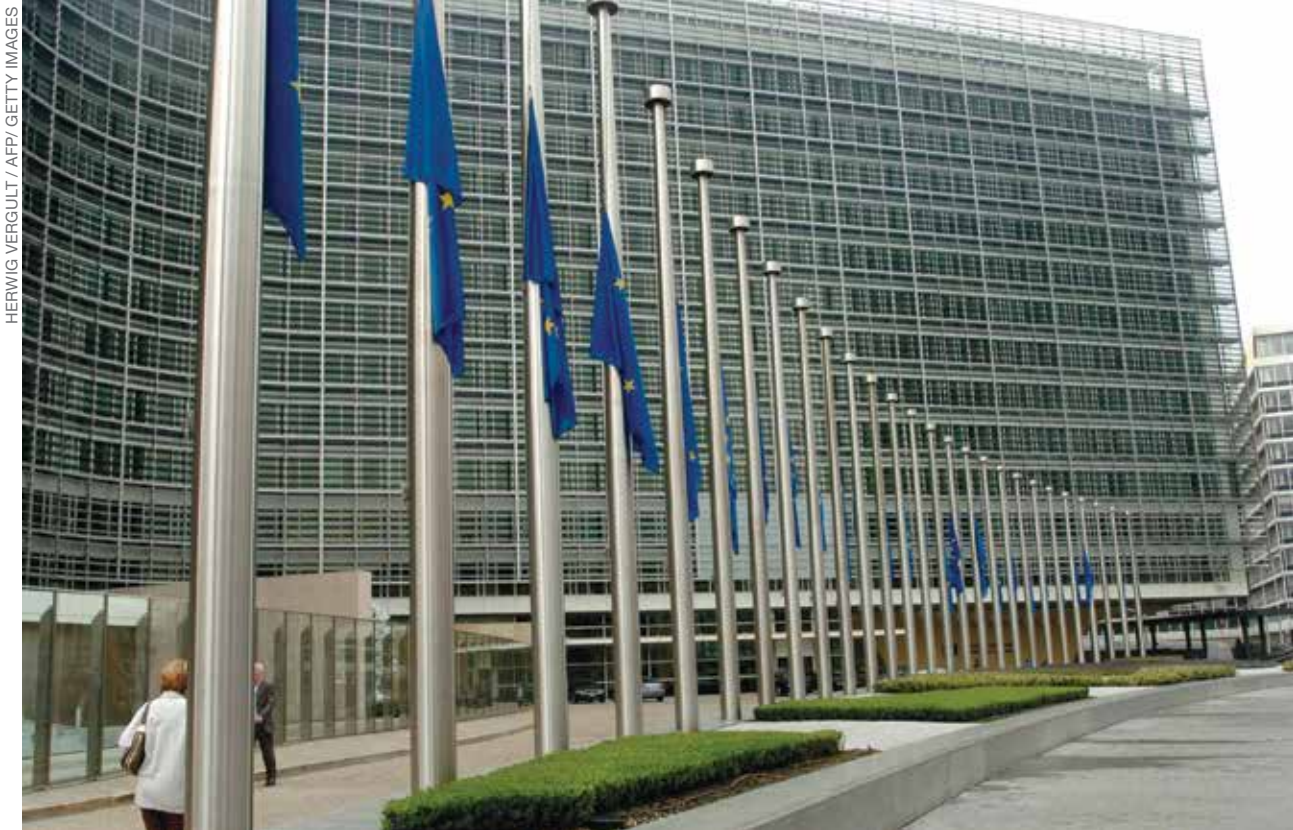
LE QUARTIER GÉNÉRAL DE L'UNION EUROPÉENNE Dix nations ou groupes de nations de l'Union Européenne, dont le quartier général est à Bruxelles, en Belgique, sont prophétisées de former la résurrection finale du Saint Empire romain.

quatrième, l'Empire romain. Le dernier empire fut divisé, avec ses capitales à Rome et à Constantinople (appelée maintenant Istanbul).