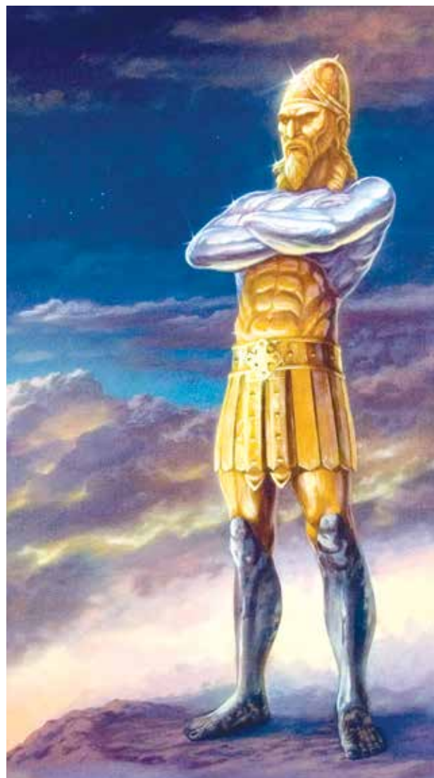
IMAGE DE L'AVENIR L'image du rêve du roi Nebucadnetsar, inspirée par Dieu et décrite dans Daniel 2, a transmis un message important, à la fois immédiat et prophétique.

Dieu révéla par le prophète Daniel que la grande statue métallique représentait une succession de gouvernements dirigeant le monde. Le premier était la tête d'or. Il représentait Nebucadnetsar et son royaume, l'Empire chaldéen. Après lui devait venir un second, ensuite un troisième royaume « qui dominera sur toute la terre ». La prophétie se réfère à des royaumes ou des empires qui gouvernent le monde.