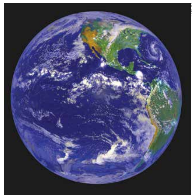
PLANÈTE TERRE Notre planète resplendissante sera le lieu futur du Royaume de Dieu.

L'évangile de Christ est la proclamation prophétique du gouvernement mondial à venir pour diriger toutes les nations et apporter la paix et la joie à la Terre qui est aujourd'hui confuse, chaotique, et lasse de guerre !