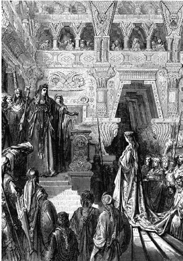
LA REINE DE SEBA Représentée ici s'approchant du Roi Salomon, la reine du Midi aura sa chance de salut après le Millénium.

les mêmes chances de salut qu'Il donne à présent à ceux qu'Il appelle en cet âge. Cependant, ils n'auront pas ; eux à subir l'influence de Satan, ce qui est le cas aujourd'hui, parce que Satan aura déjà été finalement envoyé vers son châtiment (Apocalypse 20 : 10).