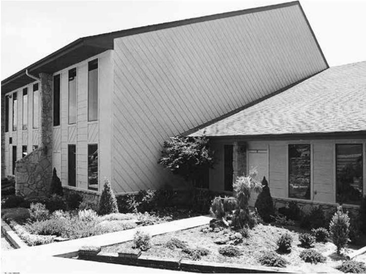
Siège central de l'Église de Philadelphie de Dieu à Edmond, en Oklahoma.

DE PHILADELPHIE NE PROTÈGENT PAS LA VÉRITÉ DE DIEU, ELLE CESSERA D'EXISTER SUR CETTE PLANÈTE!