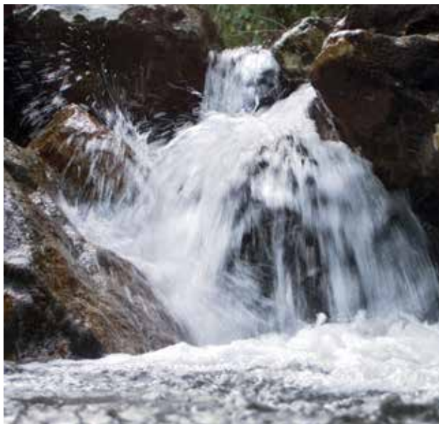
EAU VIVE Des fleuves d'eau vive, symbolisant le Saint Esprit de Dieu, couleront librement de la nouvelle Jérusalem.

La grande majorité d'entre eux se sera soumise à Dieu et aura reçu le don de la vie éternelle. Les centaines de milliers de personnes qui se sont qualifiées pour des responsabilités dans le Royaume de Dieu avant la Seconde venue du Christ, ainsi que les millions de personnes qui se seront qualifiées pour des responsabilités similaires pendant Son règne de 1 000 ans sur la Terre et les milliards de personnes qui se seront qualifiées pendant la période de jugement de 100 ans seront membres de la famille spirituelle de Dieu.