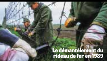
Le démantèlement du rideau de fer en 1989