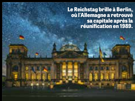
Le Reichstag brille à Berlin, où l'Allemagne a retrouvé sa capitale après la réunification en 1989.

« L'appel à une union politique en Europe va se faire plus pressant, et d'ici peu, nous verrons le marché commun se transformer en États-Unis d'Europe. »