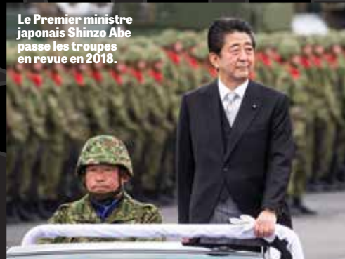
Le Premier ministre japonais Shinzo Abe passe les troupes en revue en 2018.

« Le Japon soutient des liens de sécurité étroits avec l'Inde et la Corée du Sud dans l'Indo-Pacifique »