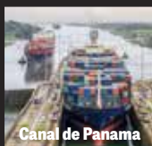
Canal de Panama

portes maritimes : Panama, Hong Kong, Suez, le cap de Bonne-Espérance, Malte, la Papouasie-Nouvelle-Guinée, Timor, les Antilles, Gibraltar, les Malouines, Chypre, le golfe de Guinée, les Maldives, le Sri Lanka, Singapour, le golfe d'Aden et d'autres.