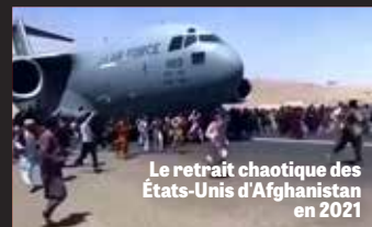
Le retrait chaotique des États-Unis d'Afghanistan en 2021