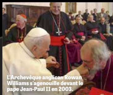
L'Archevêque anglican Rowan Williams s'agenouille devant le pape Jean-Paul II en 2003.

NOVEMBRE 1963 « Le triomphe final — quoique de courte durée, du catholicisme est mentionné dans des dizaines de prophéties bibliques. [...] Le problème majeur de la réalisation de l'unité est double. Premièrement, cela implique la réconciliation du schisme orthodoxe, qui a officiellement commencé en 1054 et a divisé les Églises en d'Orient. [...] Deuxièmement, cela implique la restauration à la communion romaine de tout le protestantisme qui s'est développé à partir de 1517. »