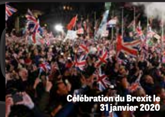
Célébration du Brexit le 31 janvier 2020

« Le Jour du Brexit : le Royaume-Uni quitte officiellement l'Union européenne »