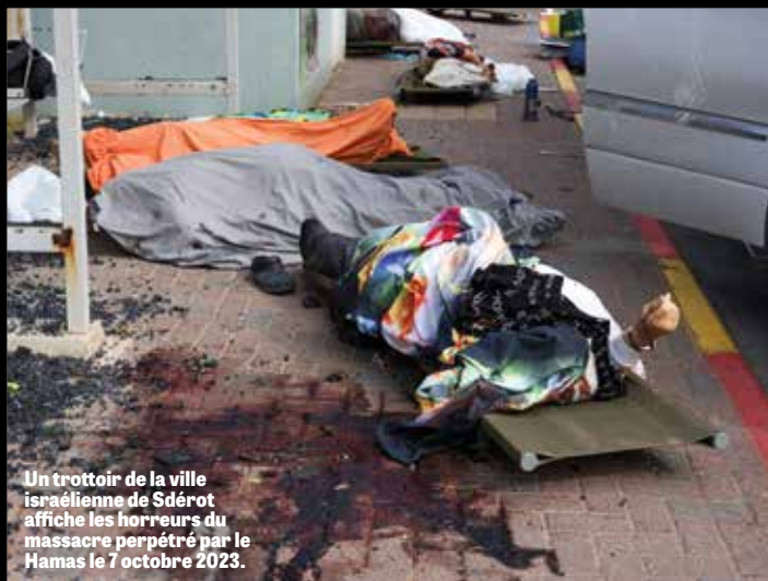
Un trottoir de la ville israélienne de Sdérot affiche les horreurs du massacre perpétré par le Hamas le 7 octobre 2023.