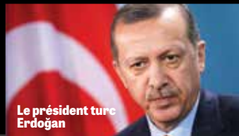
Le président turc Erdoğan

« Au milieu des bouleversements du pouvoir au Moyen-Orient, la Turquie émerge comme une menace pour les États-Unis et Israël »